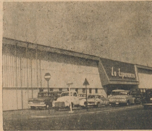
Esperanza Supermarket No. 2 Oranjestad